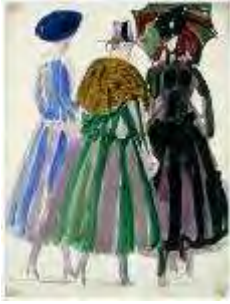
Robe de la maison Poiret , 1920 Gouache sur papier, dim. 32,6 cm x 25 cm Musée national d'art moderne, Centre Georges Pompidou, legs de Mme Raoul Dufy, 1963