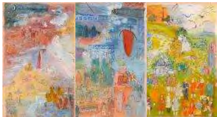
La Fée Electricité , 1952-1953