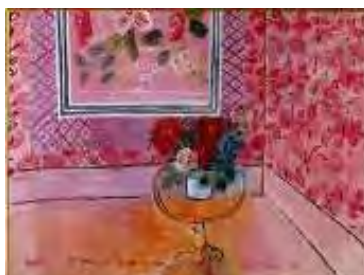
30 ans ou la vie en rose , titre attribué : 1901, 30 ans ou la vie en rose Huile sur toile, dim. 98 cm x 128 cm Paris, Musée d'art Moderne de Paris, donation de Mme Mathilde Amos, 1955