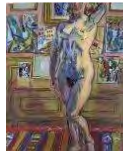
Atelier de Paris avec nu , 1944 Huile sur toile, dim. 45,8 cm x 37,9 cm Bordeaux, Musée des Beaux-Arts de Bordeaux, dépôt du musée national d'art moderne, Centre Georges Pompidou, legs de Mme Raoul Dufy, 1963 © Adagp, Paris 2021