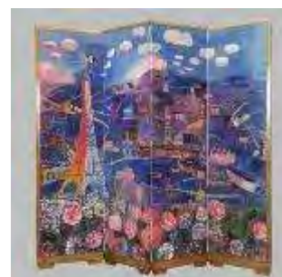
Raoul Dufy et André Groult (1884 - 1966) Panorama de Paris, 1933 Bois de hêtre, tapisserie de Beauvais, dim. 227 cm x 264 cm Paris, mobilier national et manufactures des Gobelins, de Beauvais et de la Savonnerie