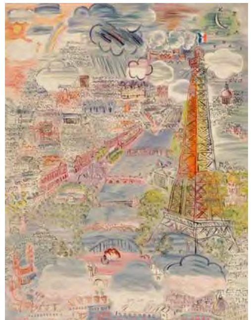
Paris, 1937 Tapisserie laine et soie, licier atelier André Delarbre, 204 x 167,5 cm, Paris, Mnam/CCI, Centre Pompidou, don anonyme, 1967