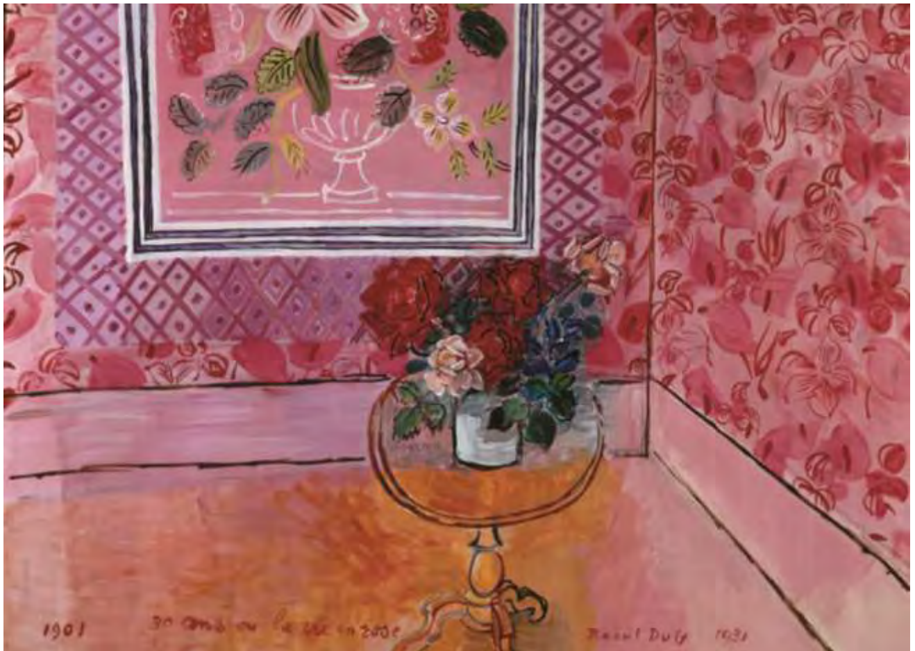
30 ans ou la vie en rose,

Il tente à travers ses séries qu'il réalise d'exprimer une synesthésie entre musique et peinture. À partir de 1946, Dufy adopte en effet, notamment dans ses hommages musicaux, un système de peinture tonale qui couvre l'ensemble de la toile (...). L'impact des couleurs est renforcé par leur place dans l'espace. Sans ombre, chaque objet possède sa couleur et son plan, affranchi de l'éclairage naturel. L'effacement du volume est complété par un rabattement de la perspective sur un seul plan. Les sols des ateliers prolongent les murs.