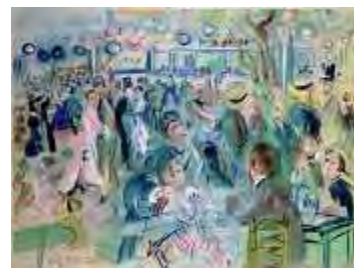
Le Moulin de la Galette , 1939 Aquarelle et gouache sur papier vélin d'Arches, dim. 50 cm x 65,5 cm Paris, Musée d'art Moderne de la ville de Paris, legs de Mme Berthe Reysz, 1975