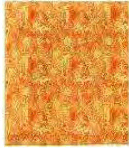
Bagatelle ou Le Pré Catelan (numéro de patron B. F. 14978) , 1919 Satin de 8, chaîne (décochement 3), 2 lats de liseré à effet damassé. Soie et schappe. Lyon, musée des Tissus, Don Bianchini-Férier, 1923 © Adagp, Paris 2021