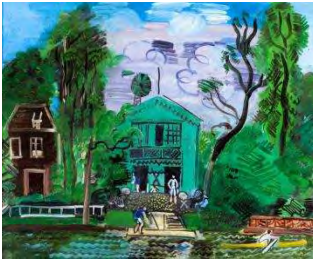
Bords de Marne, les canotiers , 1925 Huile sur toile, 60 x 72,5 cm Paris, Musée d'art Moderne legs du docteur Maurice Girardin, 1953

Dans ses jardins et paysages, Dufy reprend des pratiques du cubisme, par géométrisation et abstraction, et de son expérience de décorateur avec arcades et balustrades qui rythment les espaces. Il travaille ainsi sur un espace redressé à la verticale proche de la planéité, et surtout utilise la juxtaposition de motifs : l'échelle des différents motifs ne correspond pas à leur éloignement.