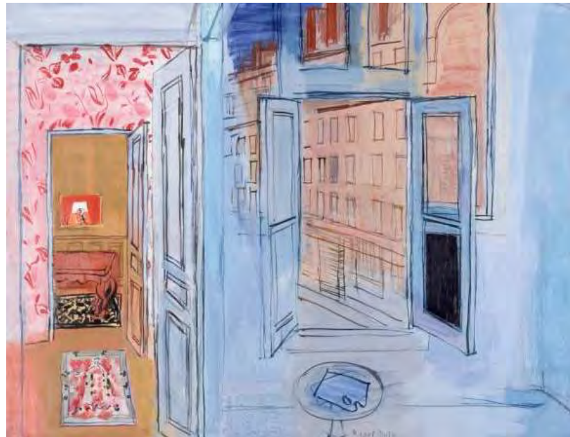
L'Atelier de l'impasse Guelma, 1935-1952

L'atelier se prête en effet à l'allégorie du lieu de création de l'artiste : un espace fermé symbolisant l'autoportrait comme métaphore pour un espace mental où s'accomplit la genèse de l'œuvre. Comme Matisse et Corot, il peint cet espace sans maître, telle une allégorie de la peinture. Ses peintures d'atelier lui permettent aussi de développer le motif de la fenêtre qui forme une interprétation privilégiée de la fusion entre l'intérieur et l'extérieur.