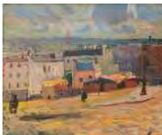
Vue de Paris depuis Montmartre , 1902 Huile sur toile, dim. 45 cm x 55 cm Collection particulière © Adagp, Paris 2021