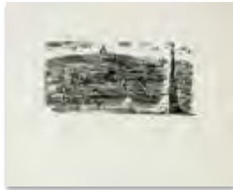
Le Poète Assassiné , 1926 Xylographie, dim. 29 cm x 23 cm. Nice, musée des Beaux-Arts Jules Chéret, dépôt du musée national d'art moderne, Centre Georges Pompidou, © Adagp, Paris 2021