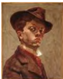
Autoportrait au chapeau mou , vers 1898 Huile sur toile, dim. 41 cm x 33 cm Le Havre, Musée d'Arts modernes André Malraux - MuMa, dépôt du MNAM, Centre Georges Pompidou © Adagp, Paris 2021

Ces conditions sont valables pour les sites internet ayant un statut de presse en ligne étant entendu que pour les publications de presse en ligne, la définition des fichiers est limitée à 400 x 400 pixels et la résolution ne doit pas dépasser 72 DPI.