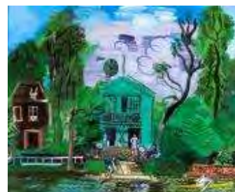
Bords de Marne, les canotiers , vers 1925 Huile sur toile, dim. 59,5 cm x 72,5 cm Paris, Musée d'art Moderne de Paris, legs du Docteur Maurice Girardin, 1953 © Adagp, Paris 2021