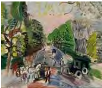
Au bois de Boulogne , 1920 Huile sur toile, dim. 46 cm x 55 cm Paris, Musée d'art Moderne de Paris, donation de Henry-Thomas, 1976 © Adagp, Paris 2021