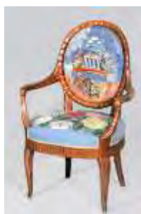
Raoul Dufy et André Groult (1884 - 1966) La Madeleine, 1933 Bois de hêtre, tapisserie de Beauvais Dim. 100 x 55 x 54 cm Paris, mobilier national et manufactures des Gobelins, de Beauvais et de la Savonnerie