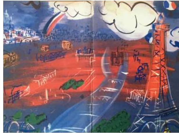
Paris, où, quand, comment, 1954, 16,5 × 11cm, Guide de tourisme de Paris imprimé par le Comité de tourisme de Paris