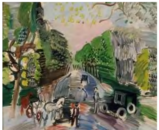
Au bois de Boulogne , 1920 Huile sur toile, 46 x 55 cm Paris, Musée d'art Moderne donation de Henry-Thomas, 1976

Il aime peindre Paris et ses alentours, insistant sur l'élégance des grilles, des allées et des jardins, révélant les architectures au milieu de la verdure. Il y place différentes petites scènes d'une vie insouciant et légère et c'est ainsi qu'il représente le bois de Boulogne, dans des compositions généralement très équilibrées qui se voient troublées par quelque élément en mouvement, comme un oiseau ou un fiacre.